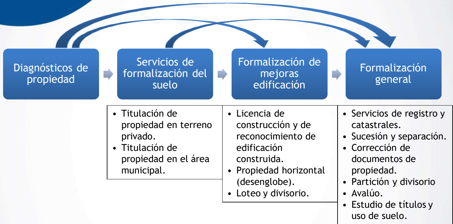
Diagrama de Servicios Ofrecidos